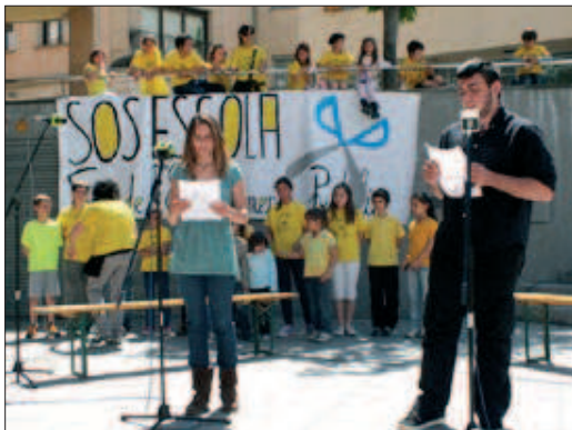
La festa va acabar amb la lectura d'un manifest reivindicatiu

Les associacions de mares i pares de les escoles públiques i instituts de la Garriga i Figaró van reivindicar diumenge amb una festa l'ensenyament públic davant de les retallades que estan patint en els darrers anys. La festa va atraure pares, mares, docents i alumnes de les dues poblacions fins a la plaça de Can Dachs, on es desenvolupava el programa. Entre altres activitats, s'hi van fer tallers escolars, es va explicar què representa la LOMCE, es va fer una tertúlia entre nens d'instituts i de les escoles per parlar del pas d'un centre a l'altre, moderada per Ràdio Silenci. Es van poder sentir mestres jubilats i en actiu