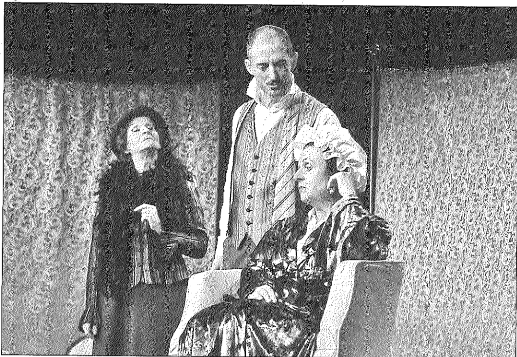
El grup va estrenar l'obra el novembre de l'any passat