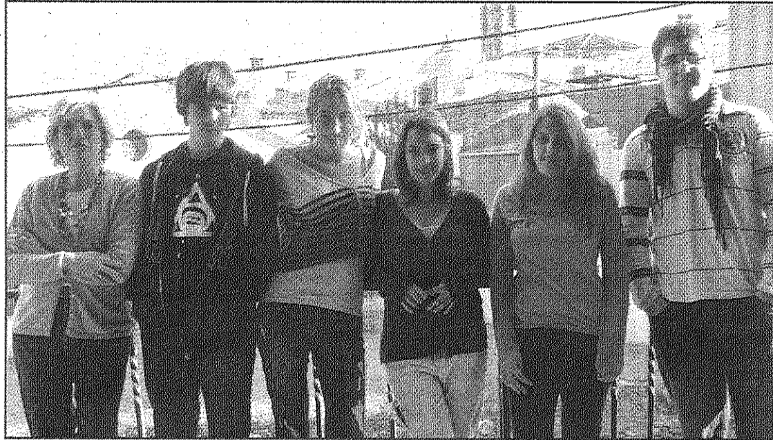
La professora i els alumnes de l'IES Baix Montseny que participen al projecte. (AIBM)