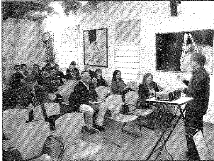
Una imatge de la sessió informativa a la Rectoria