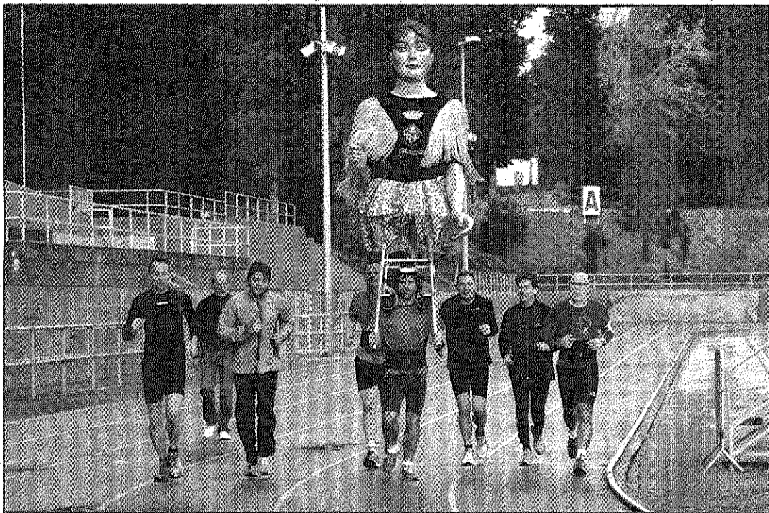
Membres de la colla de geganters s'han estat entrenant aquests dies a Can Sans