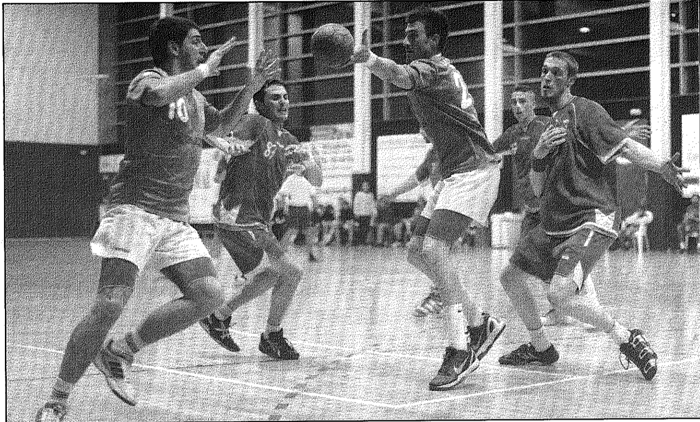
L'Handbol Palautordera juga aquest dissabte a les 8 del vespre a la pista de l'Handbol Sant Esteve Sesrovires (NEUS JULIÀ)

L'equip va deixar escapar aquest quart lloc la setmana passada en caure per 24-30 davant l'OAR Gràcia en un partit poc brillant. El Palau va començar fred, amb un parcial en contra de 1-4 fruit d'algunes imprecisions en atac que eren contestades per ràpids contraatacs de l'equip visitant. No obstant això, quan els locals es van centrar, van aconseguir remuntar amb un 5-4 que feia pensar en un partit igualat i disputat. Lluny d'això, l'OAR va infringir un altre parcial que va deixar el 5-9 al marcador. El desavantatge es va reduir a dos gols i es va arribar al descans amb un 12-14 amb esperances de capgirar el marcador.