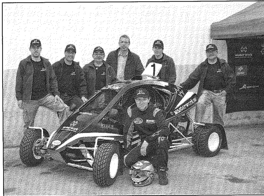
dissabte es va presentar el nou equip Car Cros Puigvert-Master Work (AABM)

L'objectiu del equip es disputar els campionats d'Espanya i Catalunya de Car Cross amb les màximes garanties d'èxit. La primera cursa del campionat estatal es disputarà aquest proper cap de setmana a les instal·lacions de Motorland, a Alcanyís, i la primera del campionat de Catalunya serà el proper 1 d'abril al circuit d'Amer.