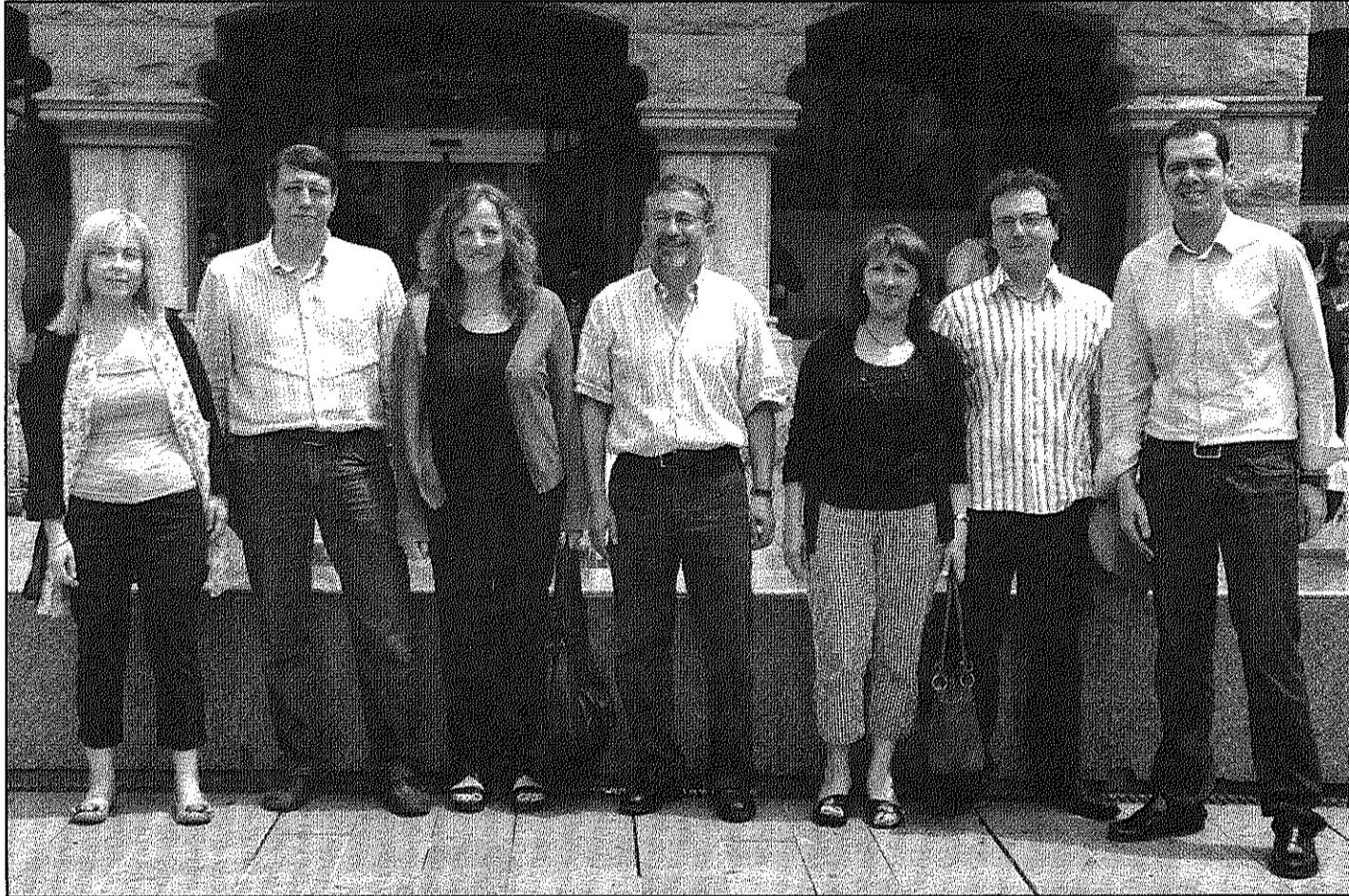
El govern municipal de Sant Celoni modifica l'estructura de les àrees de l'Ajuntament per fer-les més eficients