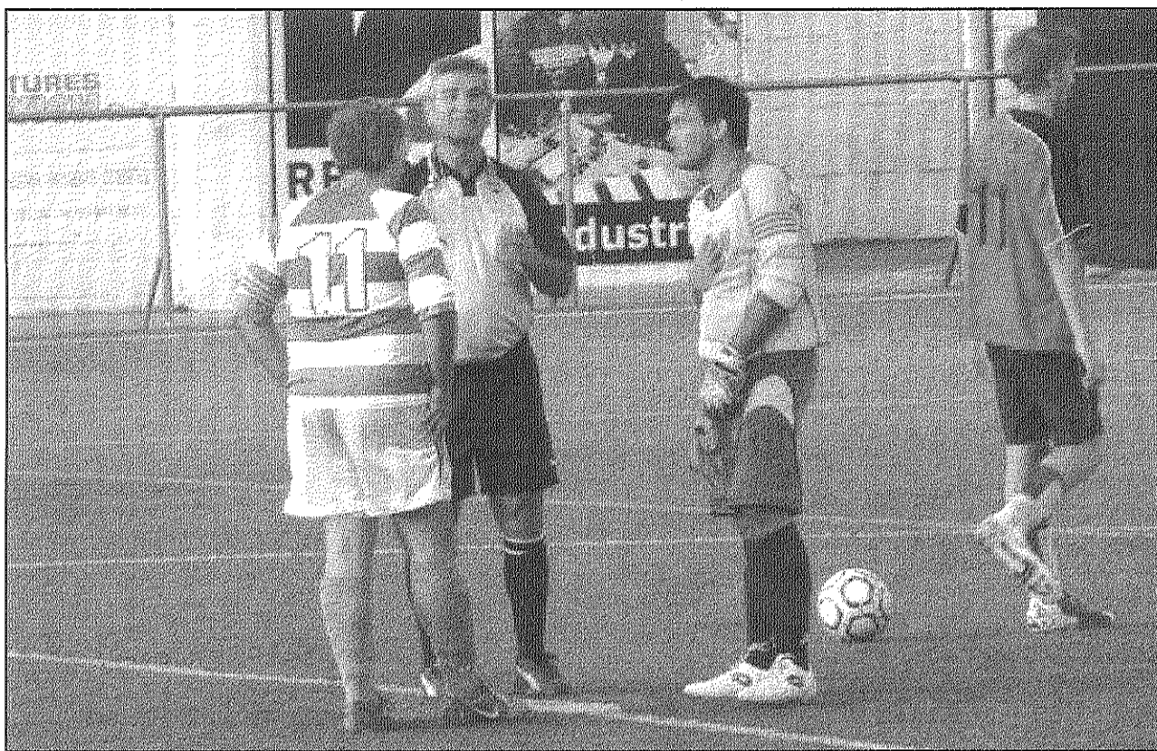
Els equips han arribat a la final després de passar una primera fase triangular amb clubs de la comarca (AdBM)