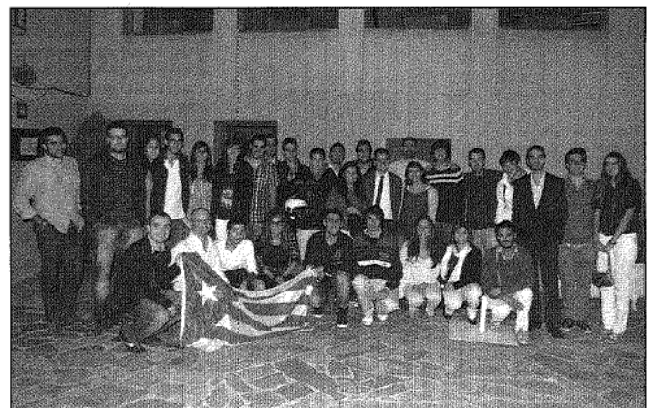
Una quarantena de joves van participar al sopar amb el director general de Comunicació (AIBM)