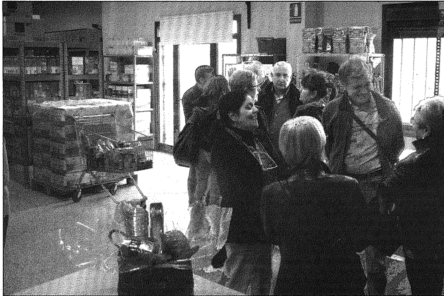
Una imatge del magatzem d'aliments que Càritas Parroquial de Sant Celoni té instal·lat a Sant Ermenter, (AIBM)

■ Els voluntaris recolliran divendres i dissabte aliments davant de les grans superfícies