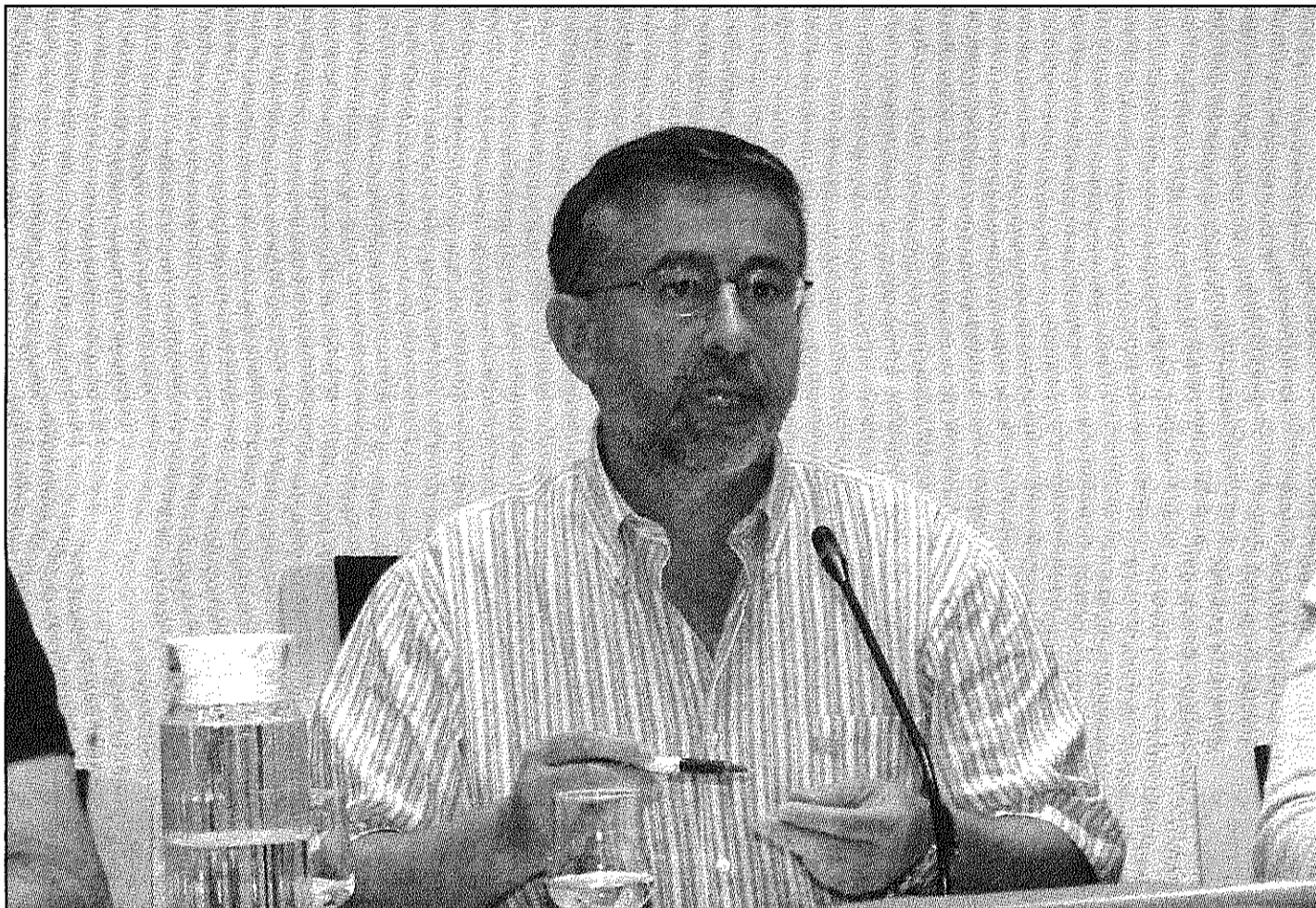
L'alcalde, Joan Castaño, va exposar als treballadors municipals quina és la situació de les arques de l'Ajuntament per al 2012 (A4BM)

En matèria de despesa, el pagament d'amortitzacions respecte el 2010 ha augmentat un 68 per cent, passant de