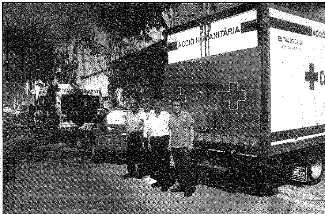
Una imatge de la presentació dels nous vehicles de Creu Roja de Sant Celoni i Baix Montseny (AaBM)

La tercera de les adquisicions és un turisme Seat Ibiza, que s'ha incorporat a l'àmbit social de la institució per poder traslladar persones grans i usuaris del programa, a més dels voluntaris dels projectes de proximitat de gent gran. Ha estat adjudicat a Creu Roja de Sant Celoni i