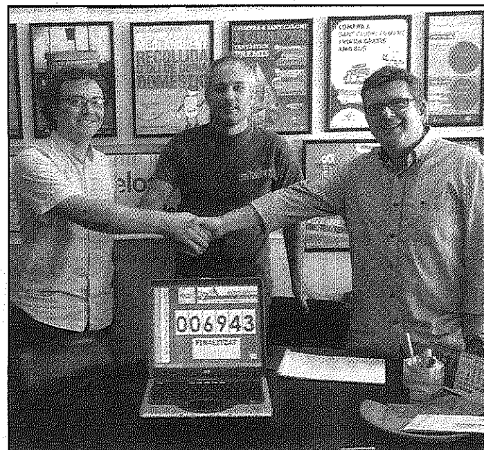
El sorteig es va fer al local de Sant Celoni Comerç (AaBM)

Entre els regals sortejats hi figuren des de vals de compra per diversos valors fins a àpats a restaurants, productes dels establiments participants i altres premis.