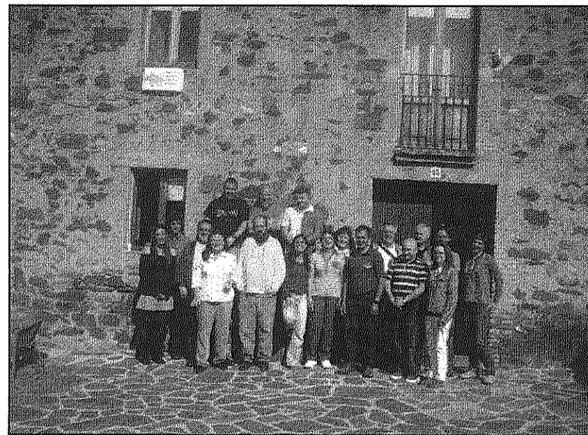
Una imatge de la trobada que van fer els empresaris