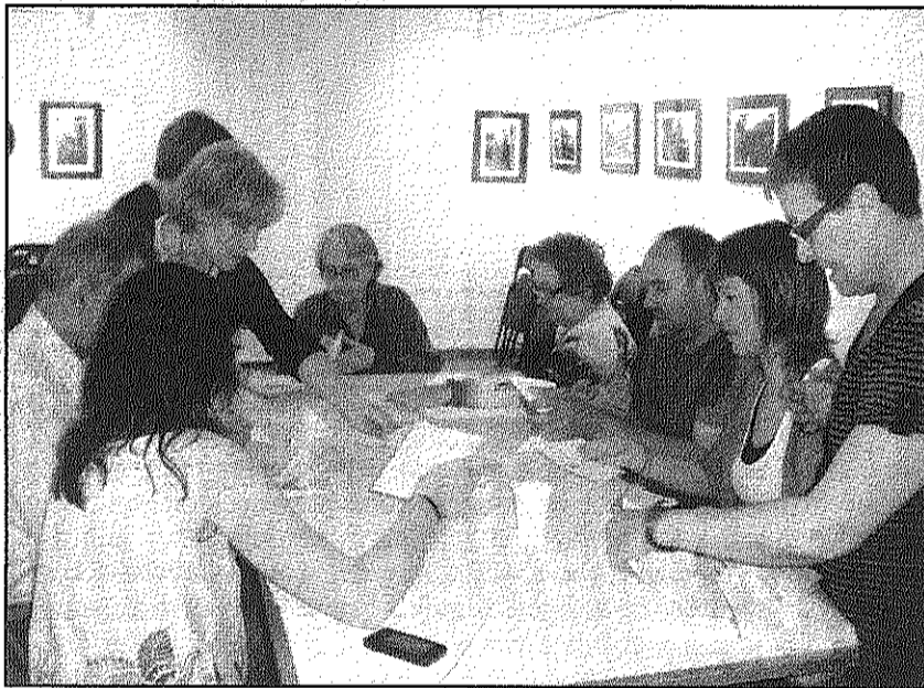
Imatges de la jornada de votacions per la independència celebrada a Campins, Fogars de Montclús, Montseny i Vallgorguina

REDACCIÓ/J.P. Sant Celoni Com ja va passar en les tres onades anteriors, aquest cap de setmana els veïns del Baix Montseny van respondre activament a la consulta sobre la independència que es va celebrar a Campins, Fogars de Montclús, Montseny i Vallgorguina. De fet, en la majoria dels casos, la participació en aquestes votacions impulsades des de la societat civil no va tenir res a envejar a la que es produeix en comitès que es convoquen oficialment. Així, a Campins hi van participar el 37,5 per cent dels veïns empa-