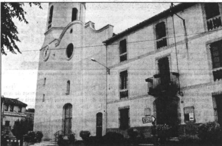
Les imatges es podran veure a l'exposició dels baixos de la Rectoria (L'AdBM)

L'ACV també ha organitzat una tómbola els diumenges 1 i 8 d'abril, el dia de rams i per Pasqua, al matí una tómbola a la plaça de la Vila amb l'objectiu de recaptar fons per totes les activitats que l'entitat organitza al llarg de l'any. La tómbola, a la que es pot participar adquirint butlletes d'un euro, assegura regals a tots els participants. El dia 8