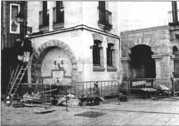
Treballs a l'edifici consistorial de Sant Celoni (L'AdBM)

La federació nacionalista considera que això ha provocat que l'import final sigui de 355.038,91 euros. Malgrat això, assenyala CiU, "l'equip de govern segueix sense assignar l'espai que fa més de 8 anys que els regidors de l'oposició demanen, ignorant la