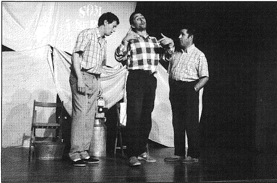
L'espectacle presentat per Tramoia va tenir una gran acollida del públic

A l'espectacle, actors i directors van procurar, segons la companyia, buscar un equilibri escènic amb els elements que conformaven l'escenografia, i buscant la connexió amb el públic, que era qui havia de donar el ritme a la representació. El resultat d'aquest treball va ser més d'una hora de