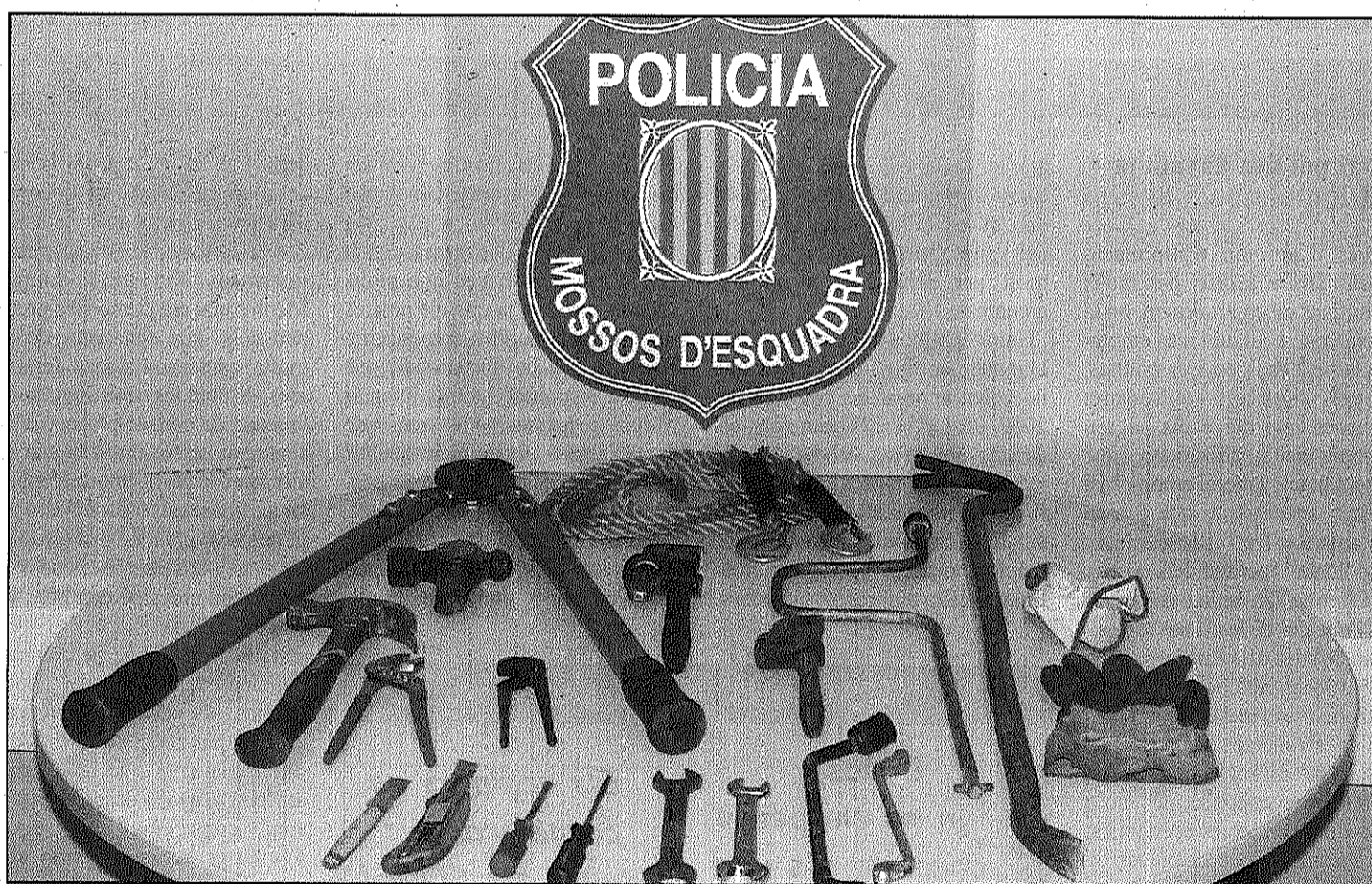
Els Mossos d'Esquadra detenen un home que havia entrat a robar a l'empresa almenys dos cops en una setmana (L'AgBM)

Els sindicats anuncien accions contundents per desencallar les negociacions laborals amb la patronal (Pàgina 5)