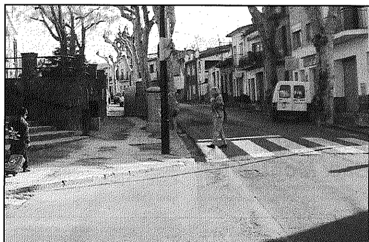
L'Ajuntament farà un estudi de mobilitat al municipi (AdBM)

Vallgorguina posa en marxa el procés de participació del POUM (Pàgina 17)