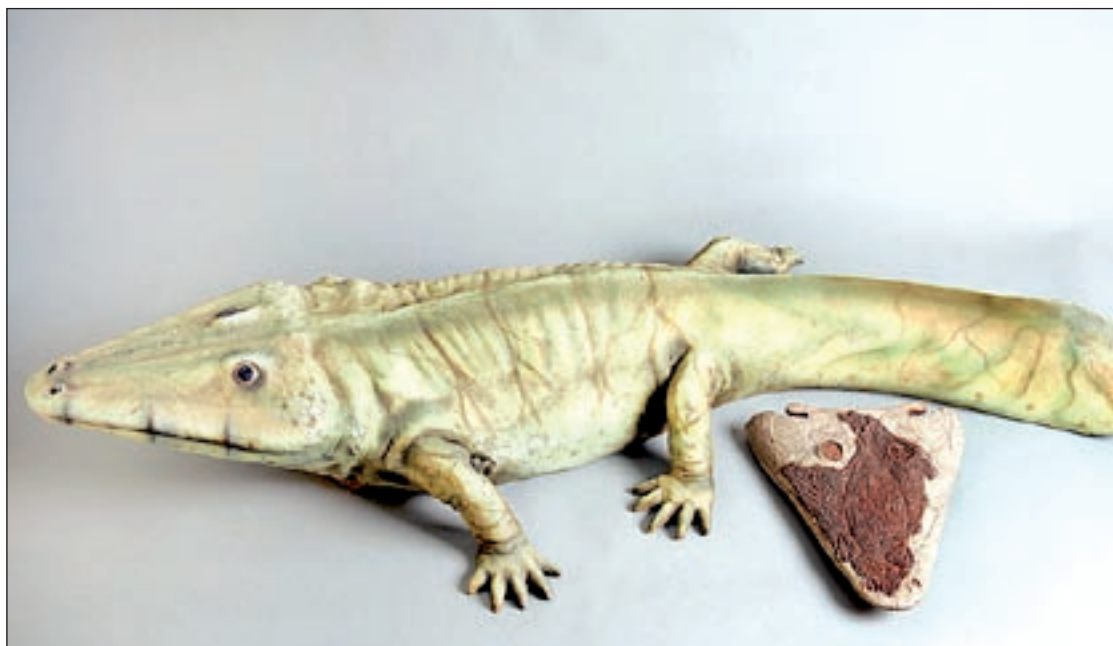
Reconstrucció de la maqueta del capitosau del Montseny