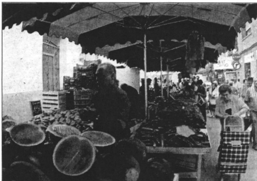
Gairebé la meitat dels usuaris del mercat són de fora de Sant Celoni (L'ADBM)

Per la seva banda, els paradistes també fan un balanç positiu del funcionament del mercat si bé consideren que s'haurien de millorar