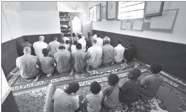
La mesquita de Sant Celoni està situada a l'avinguda de la Pau

A Cardedeu, la comunitat musulmana té la mesquita al barri de l'Estalvi. Fa un any va mirar de comprar la històrica Casa Vendrell, al centre, però l'Ajuntament