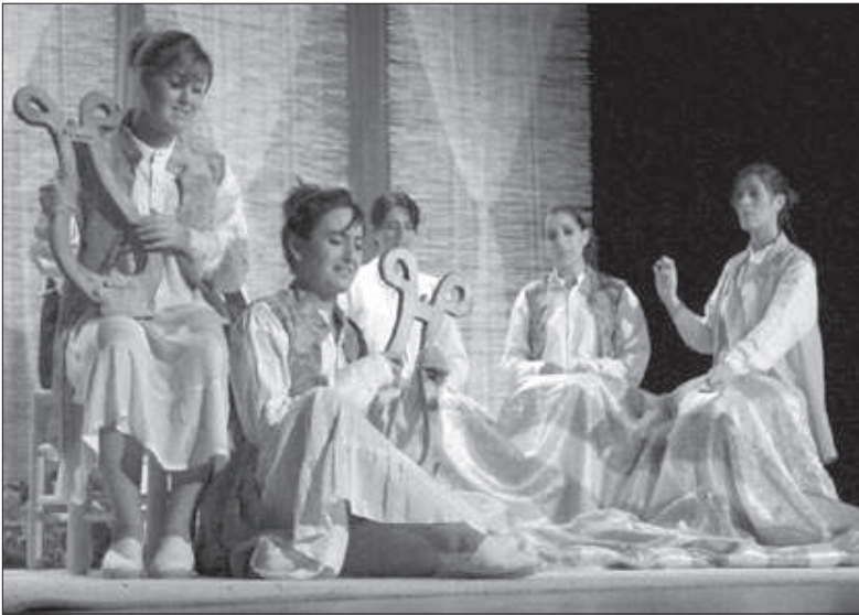
El grup Blaugrana Scena ha completat una de les millors temporades de la història amb 10 distincions